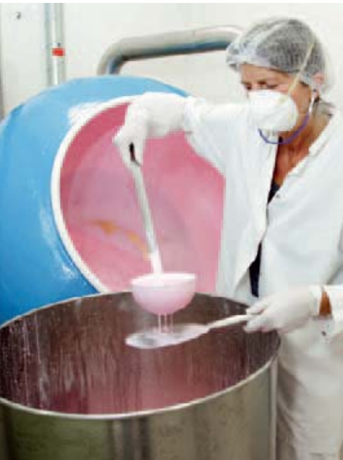
Echte Handarbeit: Den Dragees wird regelmäßig Zucker zugegeben, um eine gleichmäßige Schutzschicht aufzubauen. Ein aufwendiger und teurer Prozess – drei Tage lang bleiben die rosa Arzneien in Bewegung.